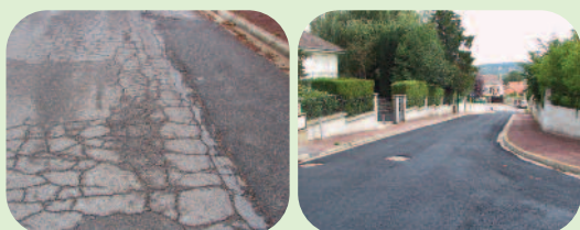
Rue du Clos Richard avant et après

Une voirie refaite à neuf est extrêmement coûteuse. Pour exemple, cette année, compte tenu des dégradations très rapides que nous avons constatées, les voiries du Clos Richard ont fait l'objet d'une étude avec demande de devis. Il faut compter en moyenne 450.000 euros par rue, trottoirs compris. Aussi, lorsque la commune fait le choix d'une réfection totale, elle s'assure au préalable que tous les réseaux présents dans le sous-sol (l'assainissement, l'eau, l'éclairage public, le gaz, l'électricité, et les télécoms) sont à jour de travaux et ceci pour plusieurs années. Inutile de vous expliquer que plusieurs hivers seront passés avant que chaque concessionnaire réponde et engage des travaux.